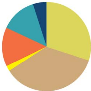
ビジネスプロセス毎のロゼッタネットの実装

過去8年間、ロゼッタネットは世界規模でコミュニティでの採用状況を評価してきました。その評価は、ロゼッタネット標準の導入に関するものです。